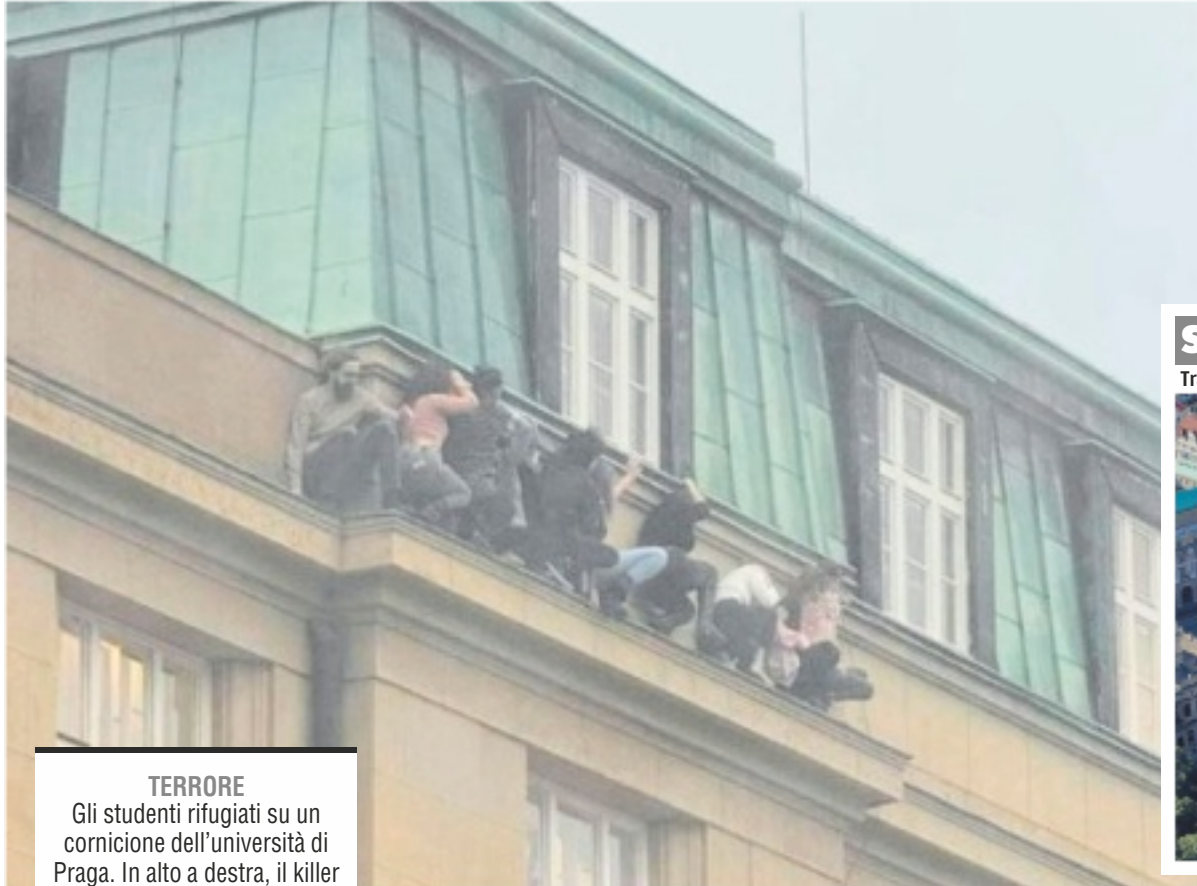
TERRORE Gli studenti rifugiati su un cornicione dell'università di Praga. In alto a destra, il killer

La polizia: 14 morti e 24 feriti. A sparare un 24enne, poi ucciso. Sui social: «Odio tutti»